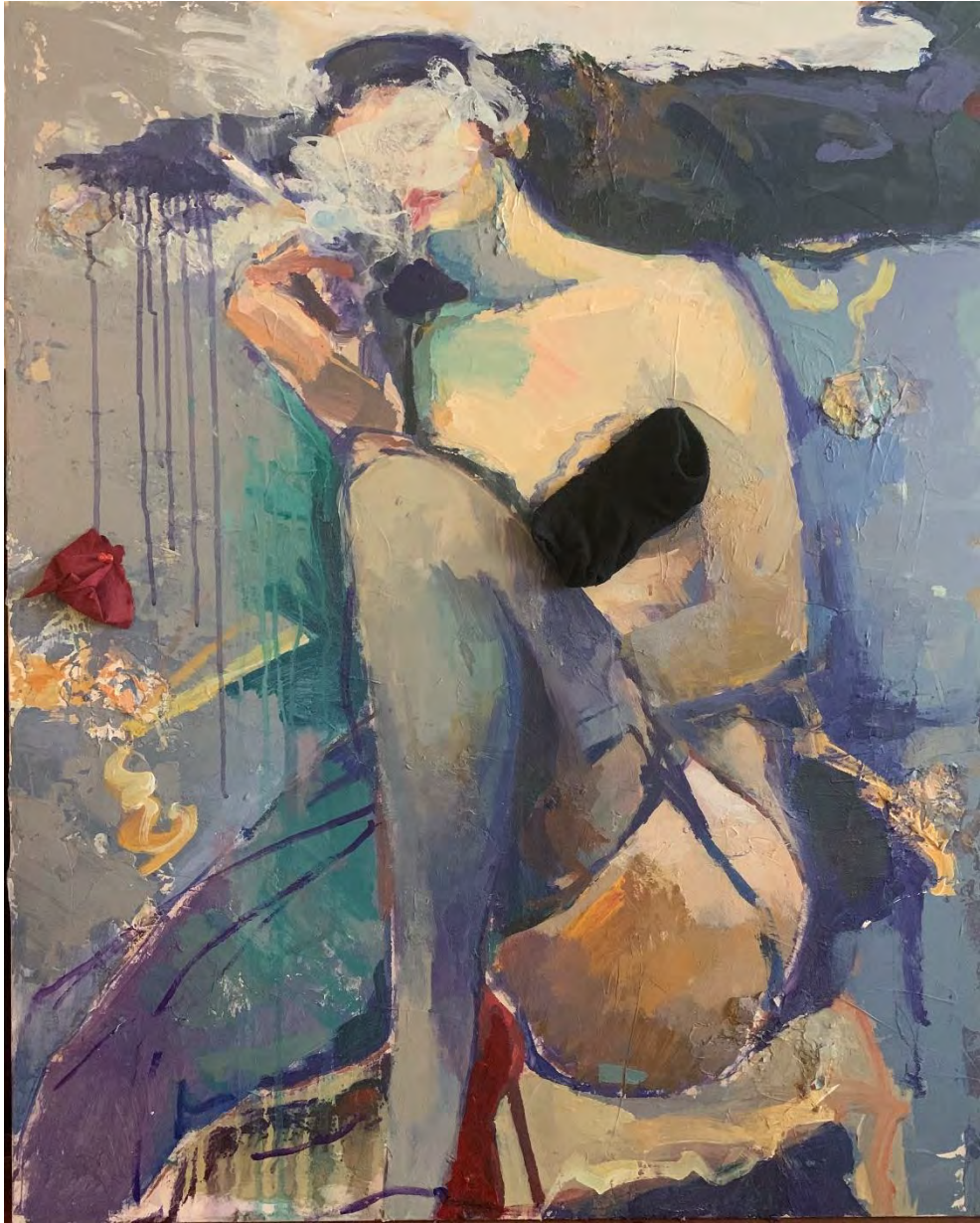
Incognito (2) / Acrylic on Canvas, Mixed Media, 100 x 80 cm, 2021