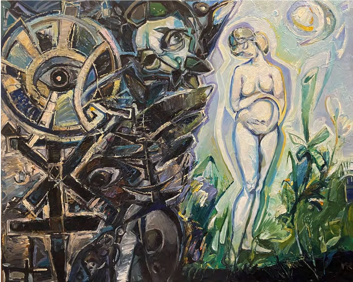
Divergence / Oil on Canvas, 80 x 100 cm, 2019