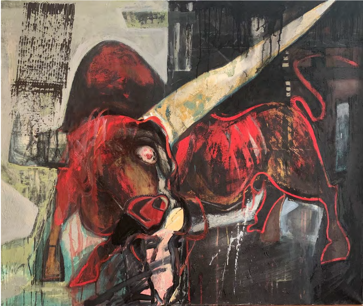
Toro Liliado / Acrylic On Canvas, 100 x 120 cm, 2021