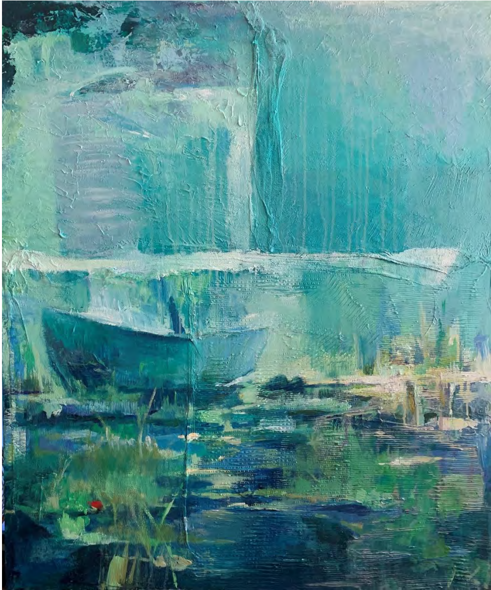
One hundred years of solitude (1) / Acrylic on Canvas - mixed media, 120 x 100 cm, 2021