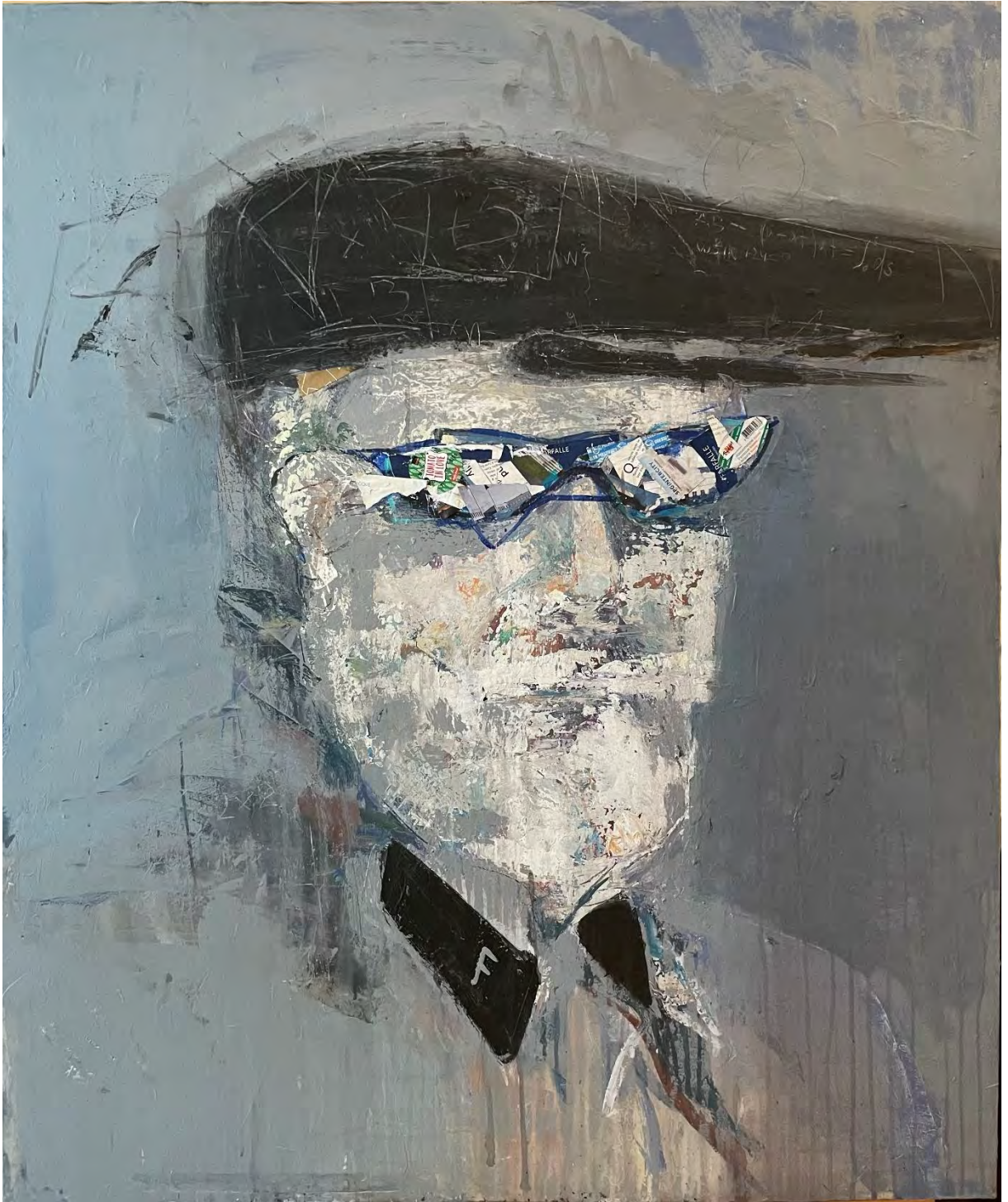
Retired agent / Acrylic on Canvas - Mixed Media, 120 x 100 cm, 2022