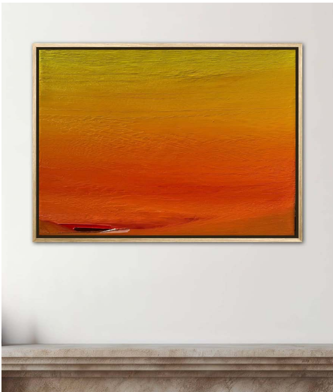
Ribal Molaeb: Sunset / oil on canvas, 70x100cm, 2024

ECHOES OF LEBANON: OIL PAINTINGS BY RIBAL MOLAEB