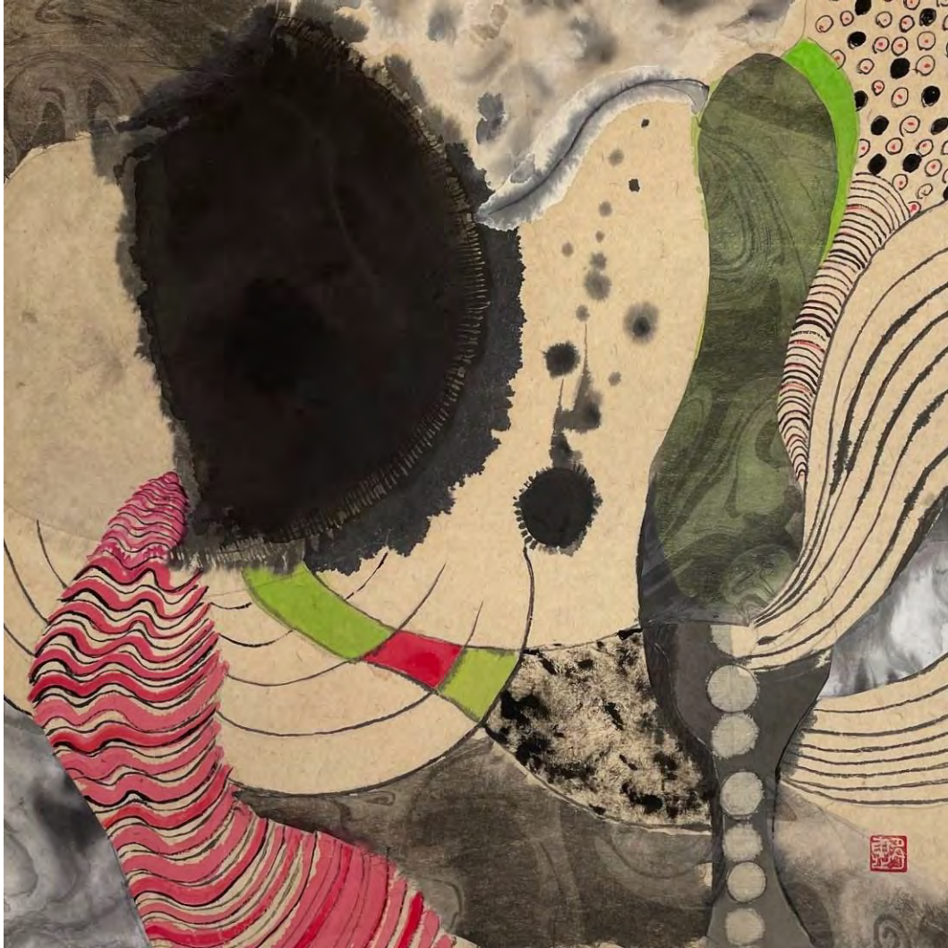
Taeko Tsunoda: Infinite Power / India ink, mineral paint on Japanese paper / 33.5 x 33.5 cm, 2023