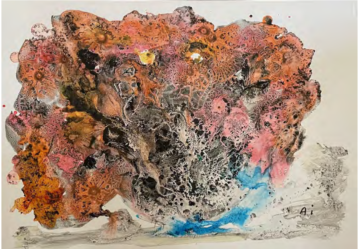
Aiko Sasaki: Nozomu / India ink, mineral paint on paper / 29.7 x 42 cm, 2024