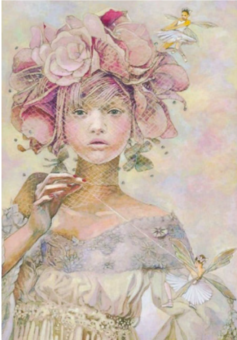
Keiko Yoda: The Fairy's Lovely Assistance / Giclee print, 36.4x25.7cm, 2023