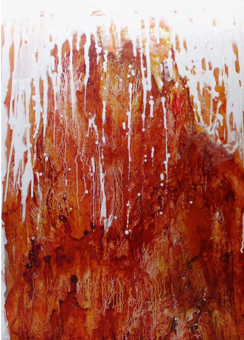
Mieko Takahashi: To The Earth II / Acrylics on canvas, 91 x 65.2 cm, 2023