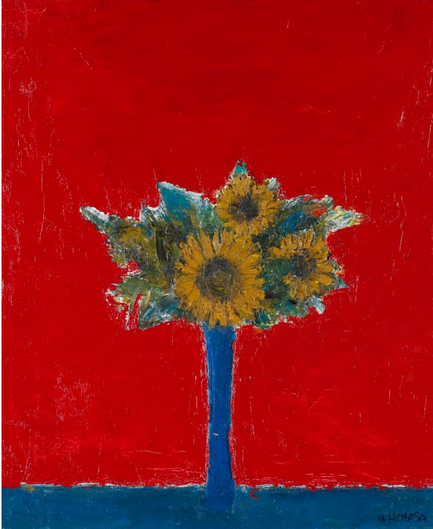
Kazumasa Hiwasa: Sunflowers / Oil on canvas, 45.5x38cm, 1989