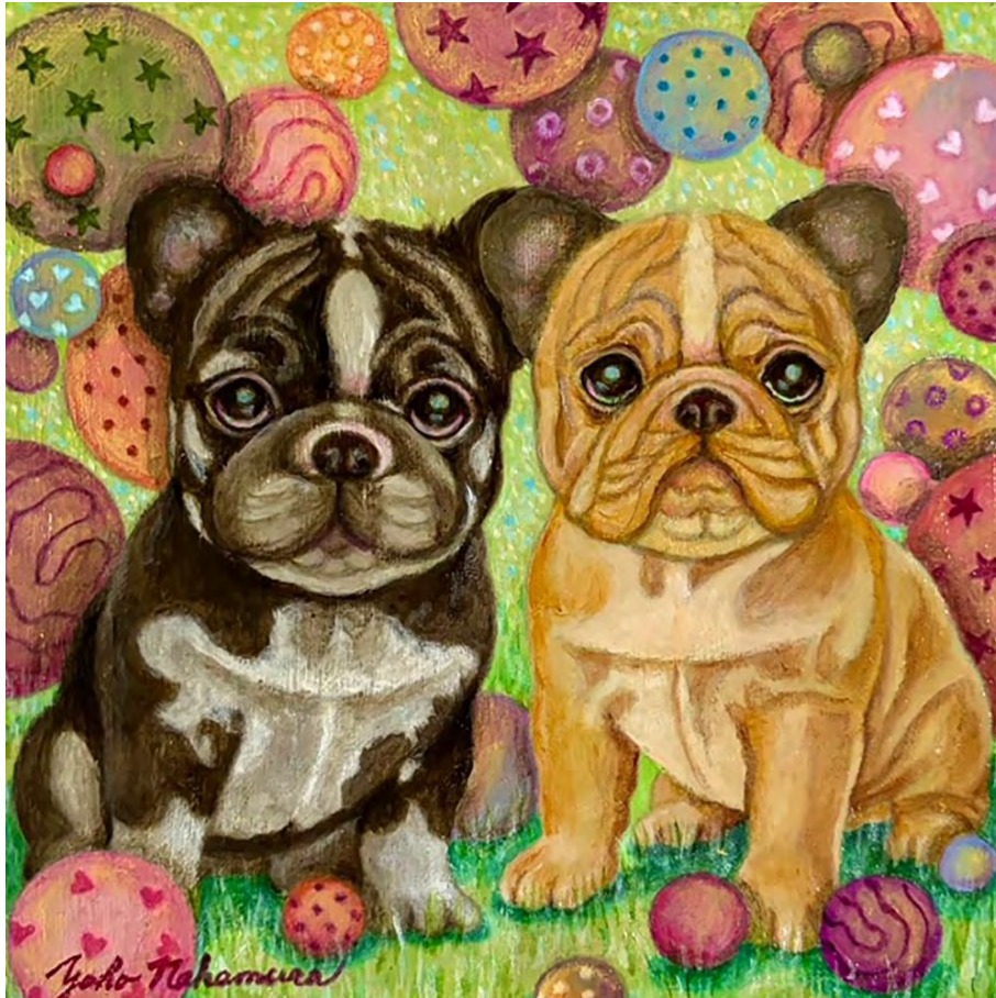
Yoko Nakamura: Future / Acrylic on canvas, 22.7x22.7cm, 2024