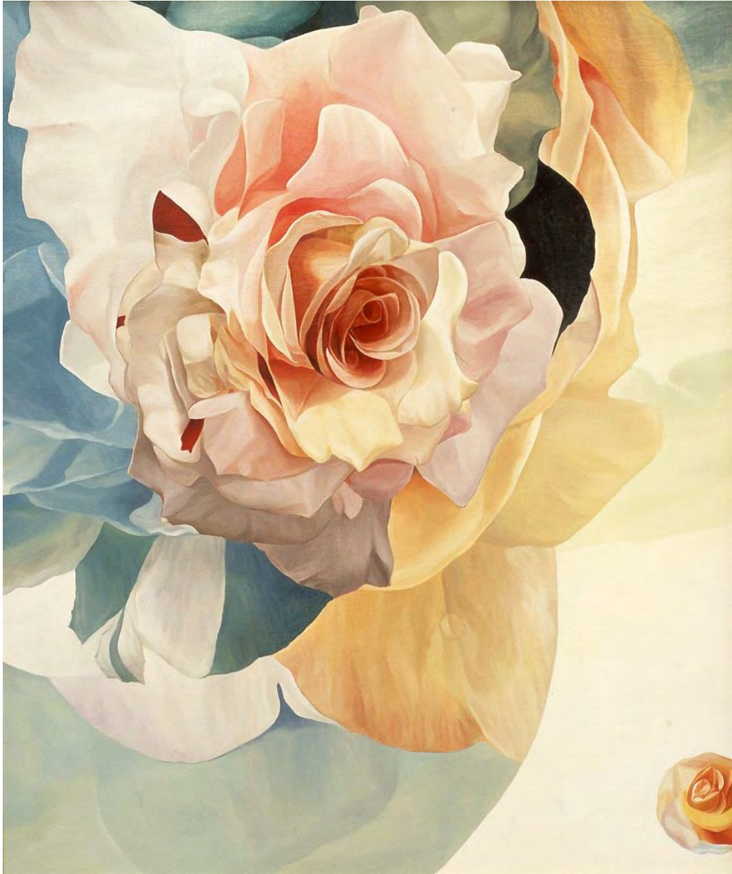
Kazuki Matsumura: The sky dawns / Oil on canvas, 72 x 60.6 cm, 2017