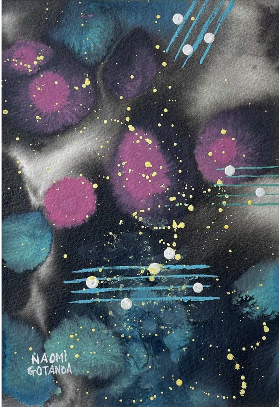
Naomi Gotanda: Polonaise / India ink, pigments, arches paper / 24x17cm, 2017