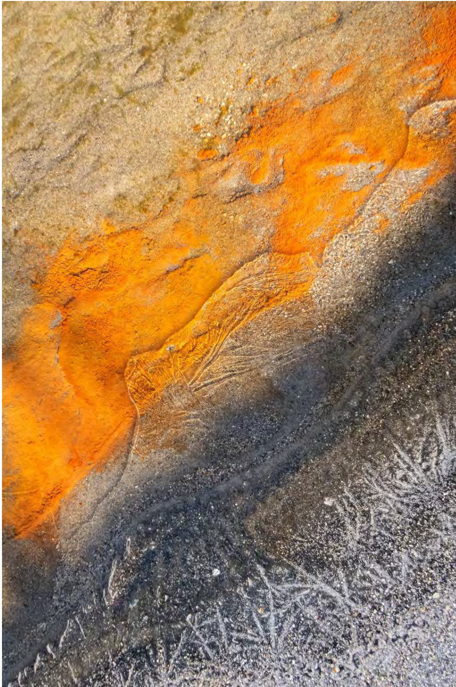
f/two artroom (Nicole und Karl Reber): riverbed / Laser exposure on photographic paper, silicone lamination behind museum glass / 60x90cm, 2023