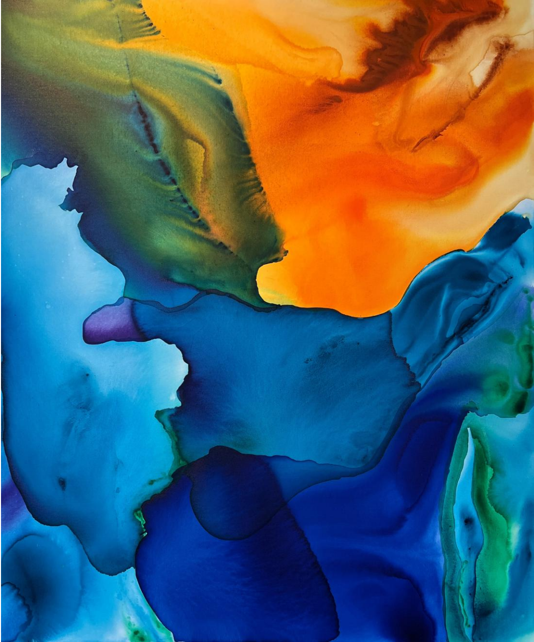
Liane Janissen: Warm dream / Airbrush on canvas, 120 x 100 cm, 2024