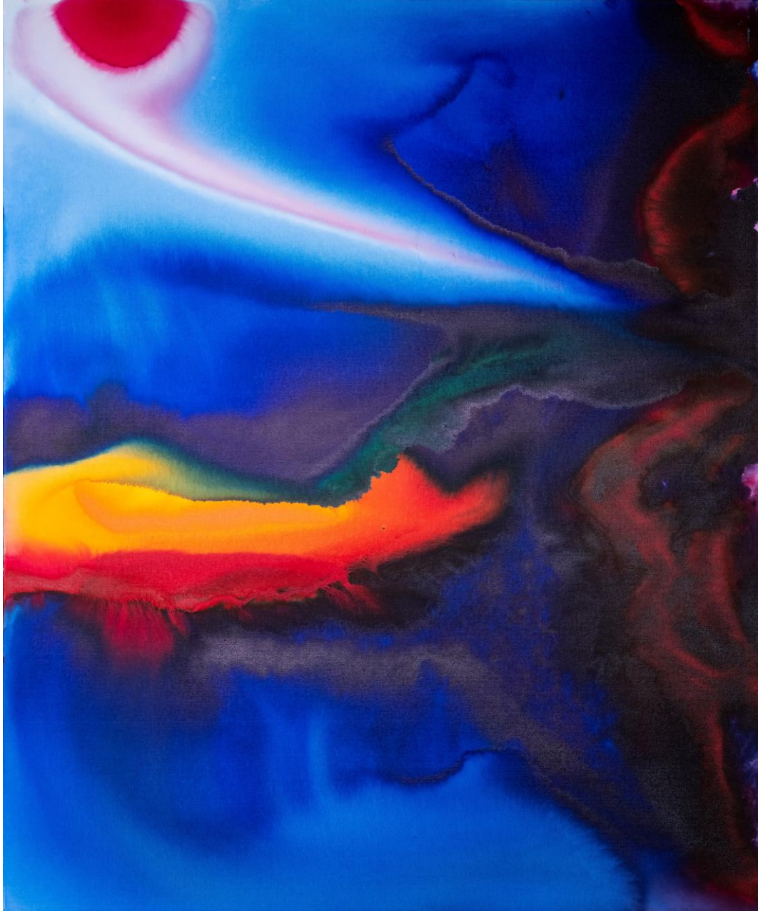
Liane Janissen: Zugersee / Airbrush on canvas, 120 x 100 cm, 2023