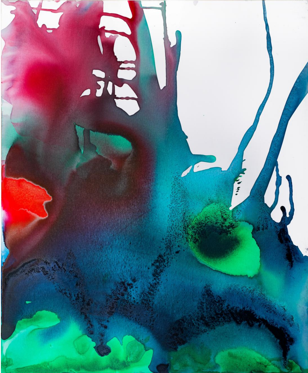
Liane Janissen: Flying colours / Airbrush on canvas, 120 x 100 cm, 2023