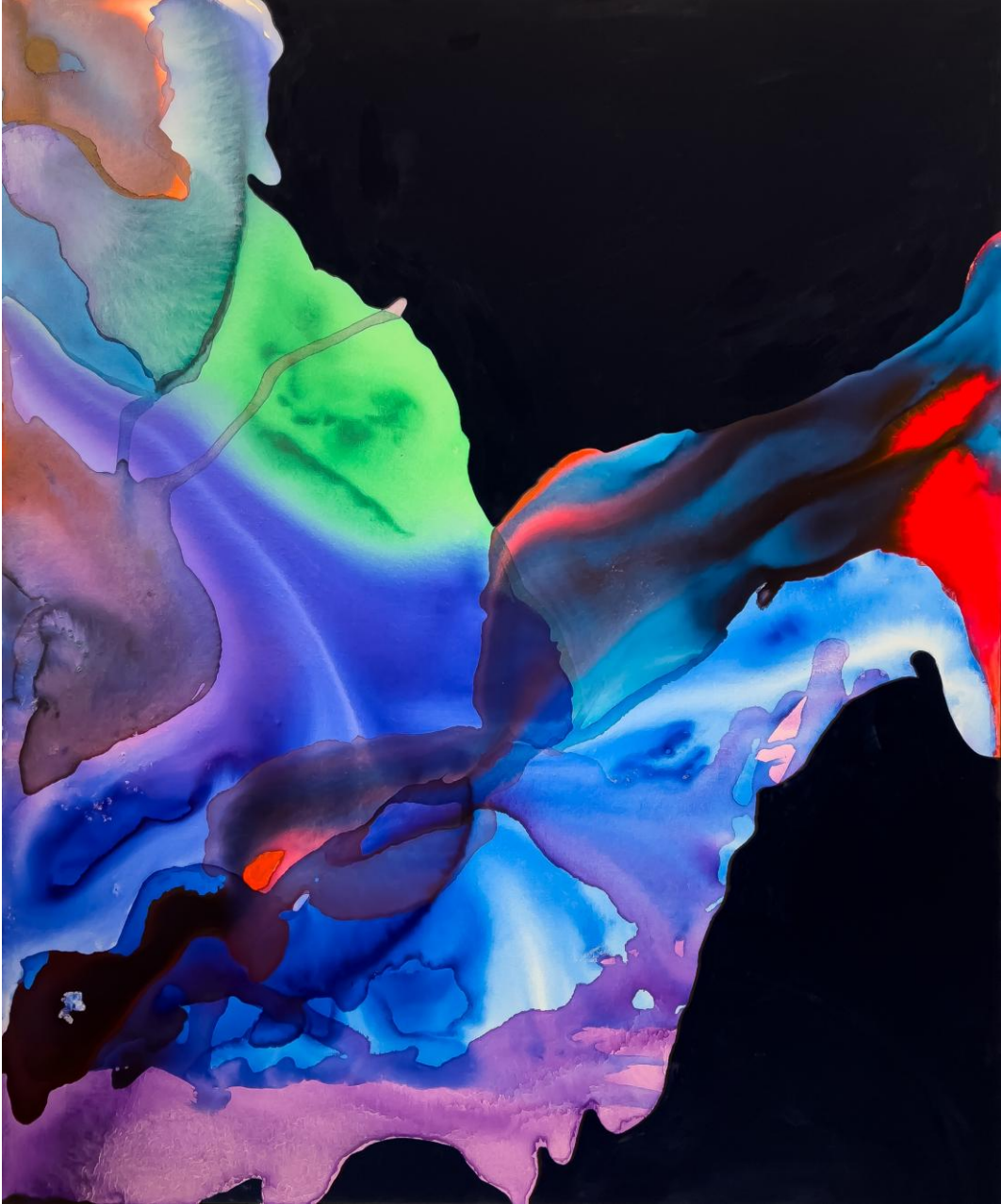
Liane Janissen: Infinite Space / Airbrush and Infinite Black on canvas, 120 x 100 cm, 2025